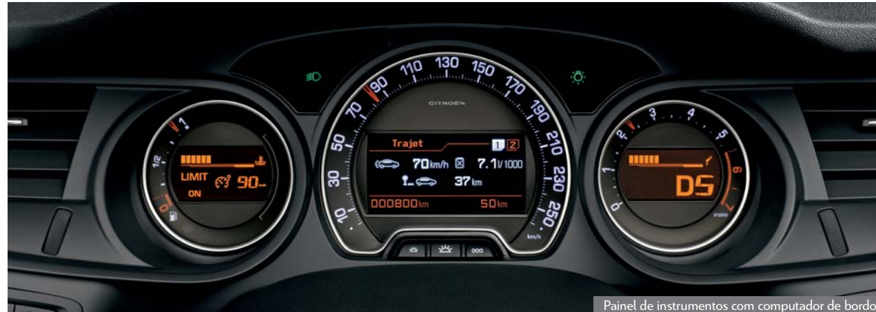
Panel de instrumentos com computador de bordo