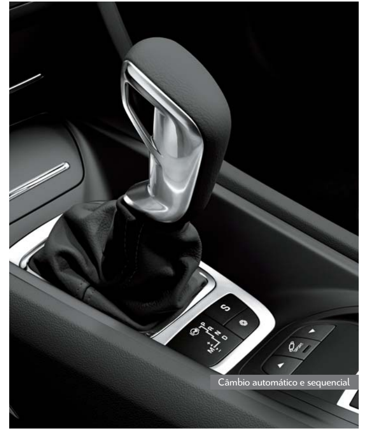
Câmbio automático e sequencial