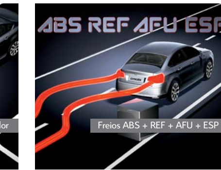
Freios ABS + REF + AFU + ESP