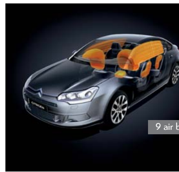
9 air bags