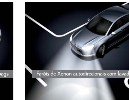
Faróis de Xenon autodirecionais com lavador